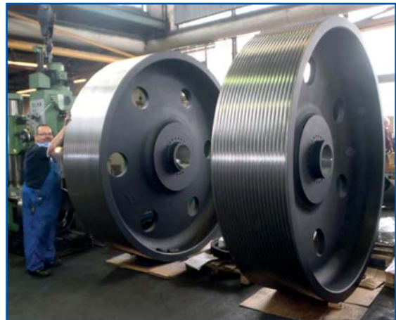
Kombination aus Schwungscheibe und Keilriemenscheibe