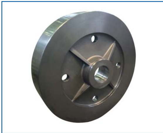
Schwungrad mit Versteifungs-Rippen für die Nabe