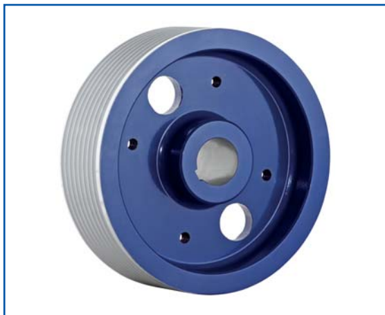
Sonderanstriche und spezifische Farben möglich